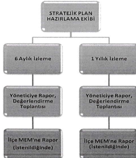
Şekil 2: İzleme ve Değerlendirme Süreci

Müdürlüğümüzün 2024-2028 Stratejik Planı İzleme ve Değerlendirme sürecini ifade eden İzleme ve Değerlendirme Modeli hazırlanmıştır. Müdürlüğümüzün Stratejik Plan İzleme-Değerlendirme çalışmaları eğitim-öğretim yılı çalışma takvimi de dikkate alınarak 6 aylık ve 1 yıllık sürelerde gerçekleştirilecektir. 6 aylık sürelerde Üst Yöneticiye rapor hazırlanacak ve değerlendirme toplantısı düzenlenecektir. İzleme-değerlendirme raporu, istenildiğinde Stratejik Geliştirme Başkanlığına gönderilecektir. Ayrıca ilimizin Mülki İdari Amirine sunulacaktır. 1 yıllık izleme-değerlendirme çalışmaları, Stratejik Planımızda yer alan hedeflerin yıllık düzeyde ifade edildiği Performans Programı ve yılsonunda gerçekleşme düzeylerinin belirlendiği Faaliyet Raporu hazırlanarak yapılacaktır. Performans Programı ve Faaliyet Raporu Üst Yöneticinin değerlendirmesinin akabinde Strateji Geliştirme Başkanlığına ve Mülki İdari Amire sunulacaktır. Yıllık izlemelerle ilgili değerlendirme toplantıları düzenlenecektir.