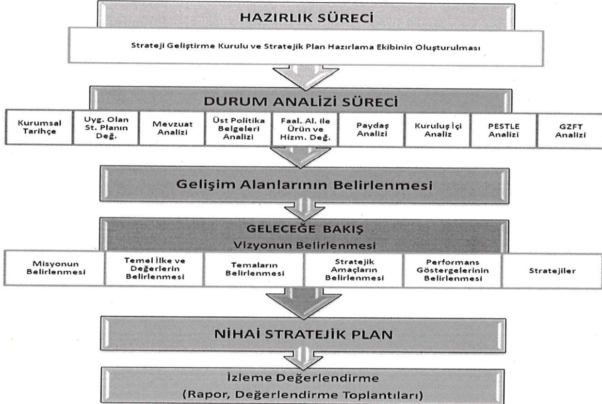
Şekil 1. Kılavuz İmam Hatip Ortaokulu 2024-2028 Stratejik Plan Hazırlama Modeli